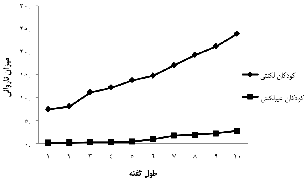
نمودار ۱- میزان ناروانی برحسب افزایش طول گفته در ده دسته جمله در دو گروه کودکان لکتی و غیرلکتی فارسی‌زبان

میزان ناروانی در جمله‌های پیچیده کوچک‌تر از p مربوط به جملات ساده است و به عبارتی، تأثیر طول گفته بر میزان ناروانی در جملات پیچیده بیشتر از جملات ساده است، می‌توان نتیجه گرفت که در جملات پیچیده، متغیر طول تحت تأثیر پیچیدگی نحوی قرار گرفته است.