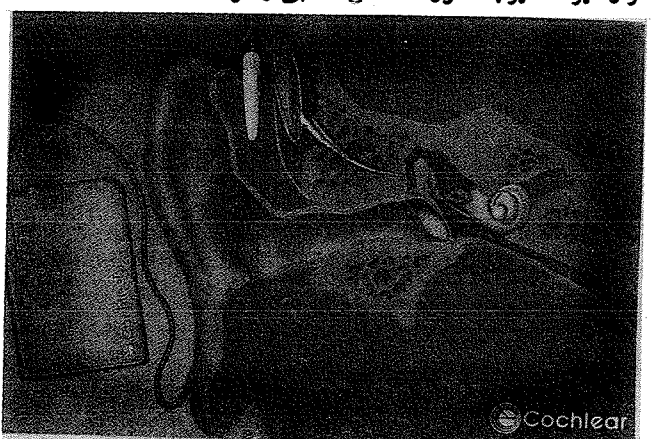
شکل ۴: کاشت حلزون ۲۲ کساناله: صوت وارد میکروفون سمعک بشت گوشی شده، سیس توسط بخش پردازنده گفتار کد بندی می شود و از طریق بوسه به وسیله بخش انتقال دهنده به گیرنده و الکترودها کاشته شده فرستاده می شود.

از خارج کردن آن از حالت رمز، سیگنال الکتریکی می باید تا حد امکان کوچک و ظریف باشد تا بسادگی در استخوان ماستویید کودکان و بزرگسالان قرار گیرد. همانند حلقه گیرنده، می بایست به منظور جلوگیری از ورود مایع های بدن، توسط یک الکترون یا اشعه لیزر پوشیده شود.