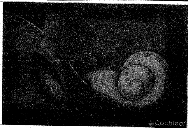
شکل ۳: الکترودهای نوار چند کساناله داخلی حلزون ششده و به صورت مجزا جهت دریافت سیگنال های الکتریکی با سطوح مختلف تیزی و بلندی و در نهایت به منظور درک بهتر گفتار برنامه ریزی می شود.

دریچه گرد یا پروموتوری قرار دارد و الکترودها مرجع (زمین) دور از الکترودها فعال و به صورت بارز در ماهیچه تمپوراليس قرار گرفته است. بنابراین در این حالت وسعت زیادی از فیبرهای عصبی تحریک می گردد. تحریک دو قطبی (Bipolar) که در آن از جفت الکترودهای نزدیک به هم استفاده می شود، منجر به توزیع مختصر جریان می گردد. نزدیکی فیزیکی بیش از حد الکترودها، تا اندازه ای تحریک انتخابی دسته های مجزای فیبرهای عصبی را مشخص می کند. بنا به اظهار پاره ای از دانشمندان (۶) تمایز ظریف گفتاری مستلزم تحریک گروه های کوچک فیبرهای عصب شنوایی است. گروهی از محققین (۷) در سال ۱۹۸۳ به این توافق رسیدند که میان احساس تیزی (Pitch) و محل تحریک در حلزون رابطه ای وجود دارد. به واقع در کاشتهای حلزون چند کاناله، تحریک دو قطبی این توانایی را فراهم می سازد که بتوان تحریک الکتریکی را به مناطق مشخص حلزون هدایت نمود.