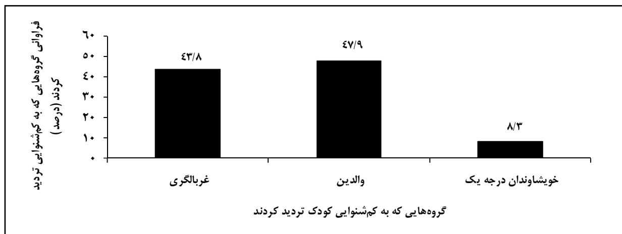
نمودار ۲- توزیع افرادی که اولین بار نسبت به کم‌شنوایی کودک تدرید کردند.

در سال ۲۰۰۴ در ایران و همچنین مطالعه جعفری و همکاران که در سال ۲۰۰۷ در ایران انجام گرفت، مطالعه حاضر کاهش مشخصی در سنین مورد مطالعه نشان می‌دهد (۱۳ و ۸) نمودار ۳ نشان‌دهنده این امر است. مشابه با این یافته، Durieux-Smith و همکاران (۲۰۰۸)، Francois و همکاران (۲۰۱۱) و Ozcebe و همکاران (۲۰۰۵) هم در مطالعات خود، بهبود در روند شناسایی زود هنگام و کاهش سن تقویت و مداخله را ذکر کرده‌اند (۷، ۶ و ۱۱). این روند بهبود را می‌توان به افزایش کاربرد برنامه‌های غربالگری شنوایی نوزادان نسبت به گذشته، گسترش خدمات پزشکی و توانبخشی و افزایش آگاهی عمومی جامعه نسبت به اثرات کم‌شنوایی بر همه ابعاد زندگی دانست. با این وجود، علی‌رغم کاهش سن تشخیص و مداخله توانبخشی در مطالعه حاضر، این یافته‌ها تنها محدود به یک مطالعه کوچک در شهر تهران است که هنوز با مقادیر توصیه شده توسط کمیته مشترک شنوایی کودکان مبنی بر شناسایی پیش از سه ماهگی و شروع مداخله قبل از شش ماهگی، تفاوت قابل توجهی دارد.