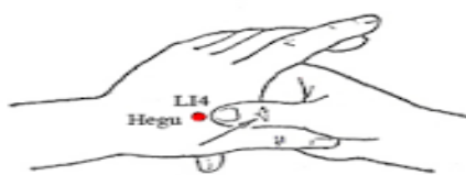
شکل ۲- محل نقطه هوگو

طب سوزنی محسوب می‌شود (۱۶ و ۱۵) و کاربرد آن نیز بسیار آسان‌تر است (۱۷). نقطه هوگو (LI4) مهم‌ترین نقطه ضد درد بدن است که در وسط نیمساز زاویه بین مفاکراپ اول و دوم دست قرار دارد (۱۷). موقعیت این نقطه در جایی است که جریان انرژی به سطح پوست نزدیک‌تر بوده و می‌تواند به راحتی و به آسانی با فشار، سوزن یا سرمای شدید تحریک شود (۱۶).