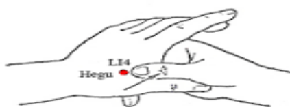
شکل ۲- محل نقطه هوگو

طب سوزنی محسوب می‌شود (۱۶ و ۱۵) و کاربرد آن نیز بسیار آسان‌تر است (۱۷). نقطه هوگو (LI4) مهم‌ترین نقطه ضد درد بدن است که در وسط نیمساز زاویه بین مفاکراپ اول و دوم دست قرار دارد (۱۷). موقعیت این نقطه در جایی است که جریان انرژی به سطح پوست نزدیک‌تر بوده و می‌تواند به راحتی و به آسانی با فشار، سوزن یا سرمای شدید تحریک شود (۱۶).