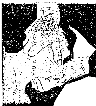
تصویر شماره ۱: باز کردن راه هوایی