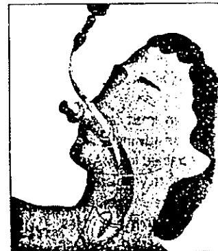
The laryngeal mask in place

تصویر شماره ۲: ماسک لارنژیال و روش استفاده از آن.