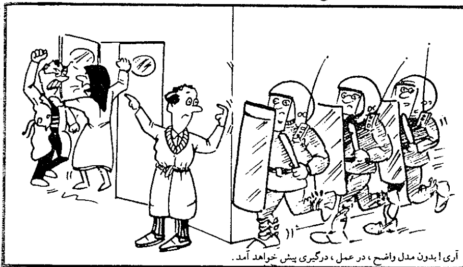
آری بدون مدل واضح ، در عمل ، درگیری پیش خواهد آمد .

اما ، دیدگاه دوم معتقد به این است که پزشک بر اساس تخصص خود راه درمان بیمار را انتخاب و نحوه آن را تجویز می‌نماید . در اینجا کسی لازم است که ضمن رفع نیازهای جسمی بیماران ، دستورات دارویی و غذایی آنان را نیز اجراء نماید . برای انجام این کار نیازی به فراگیری دروس تئوری و مبانی عمیق نبوده و صرفاً با تجربه و تمرین ، بسیاری از اعمال را می‌توان انجام داد . این دیدگاه مبتنی بر تجزیه‌پذیری انسان و سپردن هر جزء به متخصص ویژه آن می‌باشد . در اینجا دستمایه