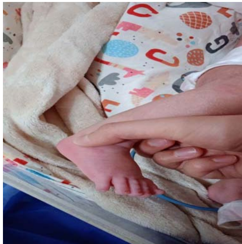
شکل ۱- نقاط Taixi-Kunlun و طریقه پیدا کردن صحیح این نقاط