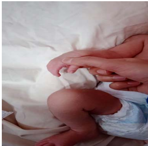
شکل ۲- نقطه Hegu و طریقه پیدا کردن صحیح این نقطه

خطای نوع اول ۸/۰۳ \pm ۱/۰۶ و ۹/۲۳ \pm ۰/۸۹ (۲۷)، خطای نوع اول یا \alpha=۰/۰۵ و توان آماری ۹۰٪ تعداد ۲۰ نفر در هر گروه برآورد و با در نظر گرفتن احتمال ریزش ۲۰ درصدی نمونه‌ها، حجم نهایی نمونه تعداد ۲۵ نفر در هر گروه در نظر گرفته شد.