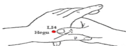
شکل ۲- محل نقطه هوگو

طب سوزنی محسوب می‌شود (۱۶ و ۱۵) و کاربرد آن نیز بسیار آسان‌تر است (۱۷). نقطه هوگو (LI4) مهم‌ترین نقطه ضد درد بدن است که در وسط نیمساز زاویه بین مفاکراپ اول و دوم دست قرار دارد (۱۷). موقعیت این نقطه در جایی است که جریان انرژی به سطح پوست نزدیک‌تر بوده و می‌تواند به راحتی و به آسانی با فشار، سوزن یا سرمای شدید تحریک شود (۱۶).