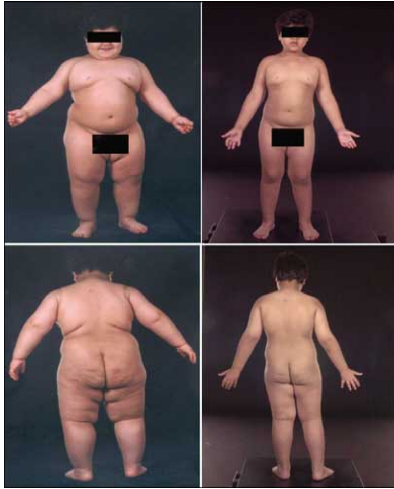
شکل ۳- پاسخ دراماتیک به تجویز لپتین در کودک دارای نقص ژنتیکی در ژن لپتین (برگرفته از:

O'Rahilly S, The genetics of obesity in humans, Chapter 8 , endotext.com , http://www.endotext.org/obesity/obesity8/obesity8.htm (Last update: 22 January 2003)