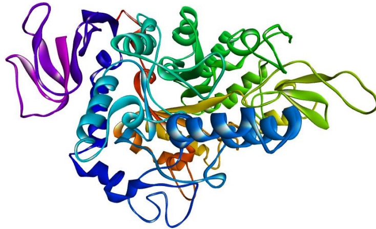
شکل ۱- ساختار سه بعدی (3D) آنزیم آلفاگلوکوزیداز با کد PDB:3a4a.