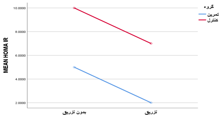
شکل ۲- نمودار میانگین بیان فاکتور HOMA-IR در رت‌های دیابتی