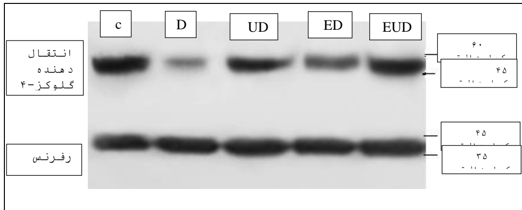
شکل ۱- تصاویر مربوط به باند پروتئین glut4 در گروه‌های مورد مطالعه

شماره‌ی آنتی بادی GLUT-4: ab216661. GAPDH: ab181602