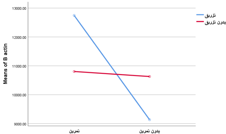
شکل ۳- نمودار میانگین سطح B-ACTIN بافت عضلانی رت‌های دیابتی نوع یک

میانگین B-ACTIN در گروه‌های تمرین مقاومتی (سمت چپ نمودار) بالاتر از بدون تمرین (سمت راست نمودار) است. همچنین، میانگین B-ACTIN در گروه تزریق (خط آبی) بالاتر از گروه بدون تمرین (خط قرمز) است در نهایت، میانگین B-ACTIN در گروه تمرین-تزریق از گروه تمرین بالاتر است.