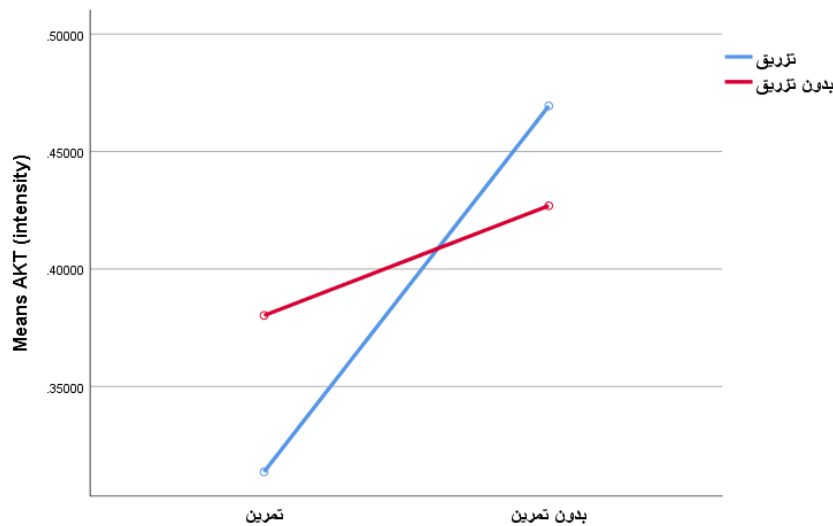
شکل ۲- نمودار میانگین سطح AKT بافت عضلانی رت‌های دیابتی نوع یک

نتایج نشان داد که بین سطح \beta -actin رت‌های سالم و دیابتی تفاوت معنی‌داری وجود نداشت ( t_{(8)}=0/987 ، P=0/353 ). نتایج تحلیل واریانس ۲ عاملی (تمرین \times تزریق) نشان داد که سطح \beta -actin بافت عضلانی رت‌های گروه تمرینات مقاومتی نسبت به