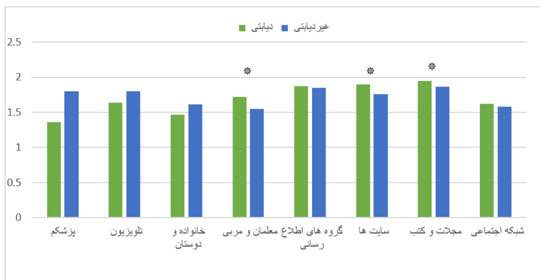
نمودار ۳- منابع اطلاعات افراد دیابتی و غیردیابتی برای آگاهی بیشتر از دیابت و درمان آن در دوران پساکرونا. * تفاوت معنی‌دار در سطح P < 0/05

از مجموع ۴۰۰ نفر واحد پژوهش خواسته شده که به یک ماه گذشته فکر کنند و به یاد بیاورند که احساساتی که اخیراً برای آنها پیش آمده است یا احساس کرده‌اند را بیان کنند. که نتیجه روان‌شناختی فعالیت بدنی به تفکیک افراد دیابتی و غیردیابتی در جدول ۳ قابل مشاهده است. همچنین از این افراد خواسته شده که به سؤالاتی که به تجربیات زندگی آنها مربوط می‌شود