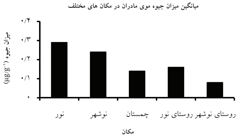
شکل ۲: بررسی اثر پارامتر مکان زندگی بر میزان جیوه موی مادر