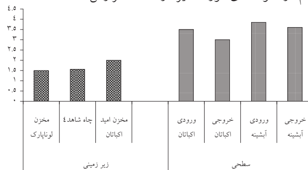
شکل ۳: حداکثر مقادیر اندازه گیری شده سم کارباریل در منابع زیر زمینی تامین آب شرب شهر همدان (خردادماه سال ۱۳۸۶)

بیشترین غلظت باقی مانده سم کارباریل در نمونه های آب برداشت شده از ایستگاه های منابع آب سطحی به ترتیب مربوط به ورودی تصفیه خانه آبشینه (۳/۸۵ ppb)، خروجی تصفیه خانه آبشینه (۳/۶ppb)، ورودی تصفیه خانه اکباتان (۳/۵ ppb) و خروجی تصفیه خانه اکباتان (۳ ppb) در خرداد ماه می باشد. در مورد نمونه های آب برداشت شده از منابع آب زیرزمینی نیز بیشترین غلظت اندازه گیری شده، سم کارباریل مربوط به ایستگاه های امید اکباتان (۲ppb) و چاه شاهد شماره ۴ (۱/۵۶ ppb) در خرداد ماه به دست آمده است و سم مورد نظر در فصل زمستان قابل ردیابی با روش مورد استفاده نبوده است. شکل ۳ نشان دهنده غلظت باقی مانده سم کارباریل در منابع سطحی و زیر زمینی تامین آب شرب شهر همدان در خرداد ماه است که بیشترین غلظت این سم در نمونه های مورد آنالیز در آن ماه گزارش شده است.