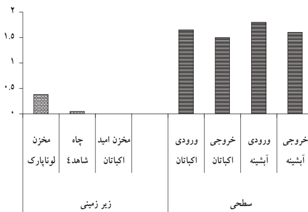
شکل ۲: حداکثر مقادیر اندازه گیری شده سم کلرپیریفوس (ppb) در منابع سطحی و زیر زمینی تامین آب شرب شهر همدان ماه (خرداد سال ۱۳۸۶)

بیشترین غلظت باقی مانده سم کلرپیریفوس در منابع آب سطحی به ترتیب مربوط به ایستگاه های ورودی تصفیه خانه آبشینه (۱/۸ppb)، ورودی تصفیه خانه اکباتان (۱/۶۵ppb)، خروجی تصفیه خانه آبشینه (۱/۶ppb) و خروجی تصفیه خانه اکباتان