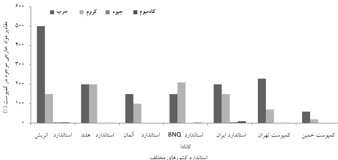
شکل ۳: مقایسه مقادیر سرب، کروم، کادمیوم و جیوه نمونه های کپوست خمین و تهران نسبت به استاندارد کشورهای مختلف (بر حسب PPM)

از ۴ میلی متر (۱۲). میزان فلزات سنگین یکی از عوامل مهم و تعیین کننده در کیفیت کپوست می باشد. با توجه به مضرات فلزات سنگین