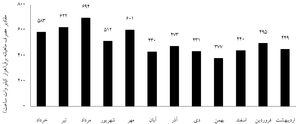
شکل ۲: مقایسه مصرف ماهیانه برق در پردیس مرکزی دانشگاه تهران از خرداد ۸۵ تا اردیبهشت ۸۶

میزان کل برق مصرفی پردیس مرکزی دانشگاه علوم پزشکی طی این دوره از مصرف معادل ۴۹۰۱۰۲۰ کیلووات ساعت بوده است. از آنجا که تقسیم بندی فضای پردیس مرکزی به تناسب ۷۰٪ پردیس دانشگاه تهران و ۳۰٪ پردیس دانشگاه علوم پزشکی تهران است، میزان برق مصرفی پردیس دانشگاه تهران طی همین مدت ۱۱۴۳۵۷۱۳ کیلووات ساعت تخمین زده می شود و در مجموع برق مصرفی پردیس مرکزی طی مدت مزبور ۱۶/۳۳۶/۷۳۳ کیلو وات ساعت برآورد می گردد. با احتساب حضور ۲۰۰۰۰ نفر دانشجوی شاغل به تحصیل