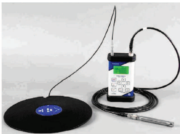
شکل ۱: نمایی از دستگاه ارتعاش سنج مدل SVAN 958