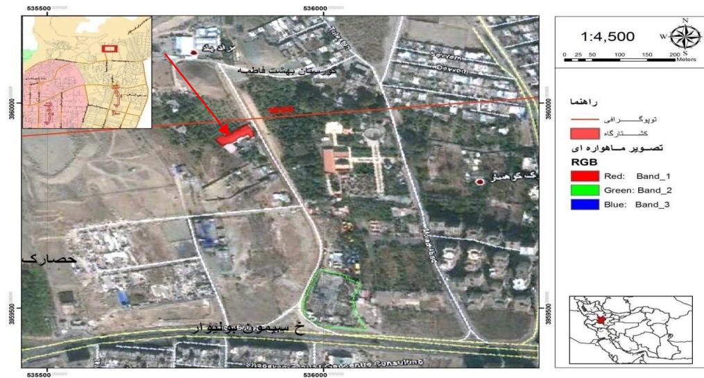
شکل ۱: موقعیت جغرافیایی محل تحقیق (۱۴)

و خطای ۳٪، تعداد نمونه‌های لازم (۳۲ نمونه) با استفاده از رابطه کوکران محاسبه گردید.