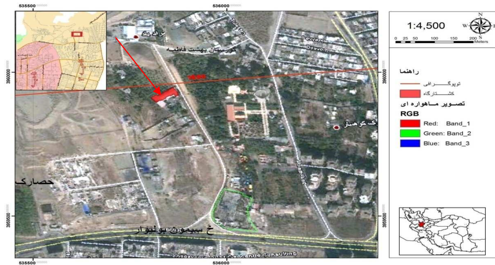
شکل ۱: موقعیت جغرافیایی محل تحقیق (۱۴)

و خطای ۳٪، تعداد نمونه‌های لازم (۳۲ نمونه) با استفاده از رابطه کوکران محاسبه گردید.