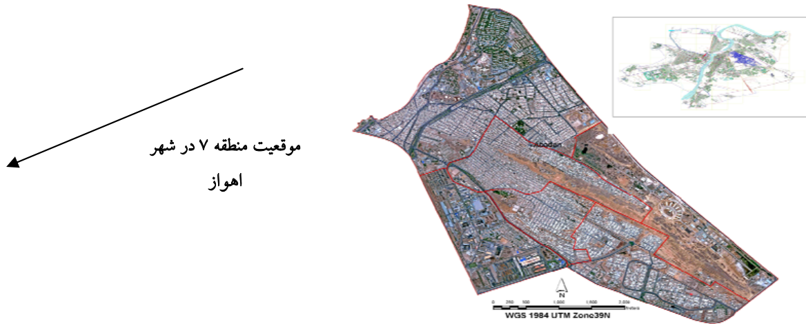
شکل ۱: موقعیت جغرافیایی منطقه حصیرآباد در شهر اهواز

به این منظور، از دستگاه اندازه‌گیری ۳D EMF TESTER مدل EMF - ۸۲۸ و روش اندازه‌گیری موجود در استاندارد (National Institute of Environmental Health Sciences) NIEHS (استفاده شد (۱۳). اندازه‌گیری شدت میدان مغناطیس در چهار فاصله ۱۵، ۳۱، ۶۱ و ۹۱ m از