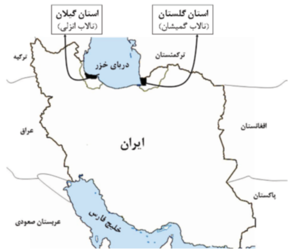
شکل ۱: نمایش منطقه مورد مطالعه

عمدتا ورود جیوه و مشتقات آن به بدن انسان، از طریق مصرف مواد غذایی و آبریان صورت می گیرد (۱۰). میانگین غلظت جیوه در بافت های مورد مطالعه به صورت جدول زیر می باشد (جدول ۱). نتایج نشان می دهند میزان جیوه در کبد همه گونه ها، به جز چنگر بیشتر از سایر بافت ها است. دلیل اصلی این موضوع به نقش کبد در فرایند متیلاسیون جیوه و درصد چربی بیشتر این بافت نسبت سایر بافت های داخلی در این دو گونه برمی گردد (۷). در چنگر به دلیل این که از یک طرف در سطح غذایی پایین تری قرار گرفته و از طرف دیگر رژیم غذایی این گونه کمتر مواد آلوده به جیوه دارد، همچنین درصد چربی بافت های آن نسبت به دو گونه دیگر کمتر بوده و طول عمر بسیار کمتری دارد، لذا میزان جیوه بیشتر در پرتجمع یافته است. همچنین عضله این گونه کمترین میزان جیوه را نسبت به همه بافت ها در هر سه گونه داشته است.