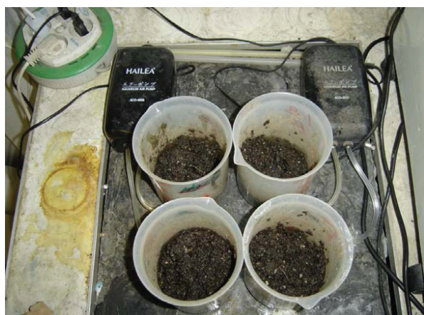
شکل ۱- راکتورهای بیولوژیکی کمپوست درون محفظه‌ای مورد استفاده