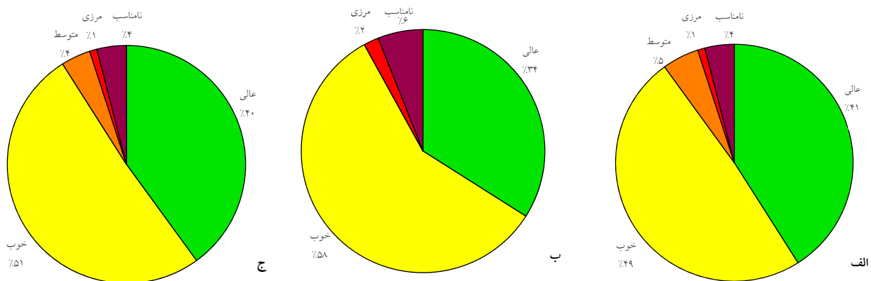
نمودار ۲- طبقه‌بندی کیفیت میکروبی آب استخرهای عمومی شهر تهران به تفکیک جنسیت: (الف) استخرهای بانوان، (ب) استخرهای آقایان و (ج) کل استخرها

توصیف و طبقه‌بندی کیفیت میکروبی آب استخرهای عمومی شهر تهران به تفکیک جنسیت در نمودار ۲ آورده شده است. همانطور که در این نمودار مشاهده می‌شود، کیفیت میکروبی آب بیشتر استخرهای مورد بررسی (هم استخرهای آقایان و هم استخرهای بانوان) در محدوده عالی و خوب قرار داشت، بطوری که از مجموع ۳۰۲ استخر مطالعه شده، کیفیت میکروبی آب در ۱۲۰ استخر عالی و در ۱۵۳ استخر خوب ارزیابی شد.