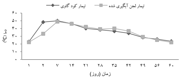
نمودار ۲- تغییرات دمایی طی فرایند کمپوست‌سازی راکتوری