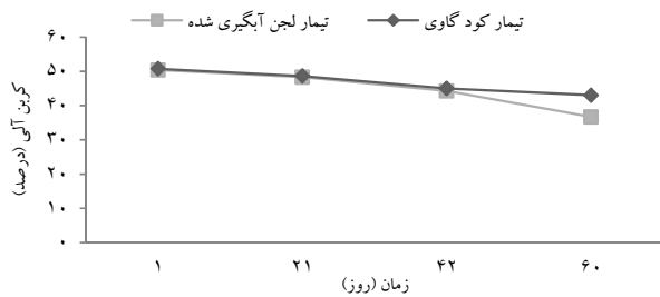
نمودار ۵- تغییرات کربن آلی طی فرایند کمپوست‌سازی راکتوری

تغییرات کربن آلی در دو راکتور با تیمار مختلف طی فرایند کمپوست‌سازی به طور معناداری ( P \leq 0/001 ) روند کاهشی داشت. کربن آلی در تیمار کود گاوی ۷/۷۲ درصد و در تیمار لجن آبگیری شده فاضلاب ۱۳/۶۹ درصد کاهش یافت (نمودار ۵).