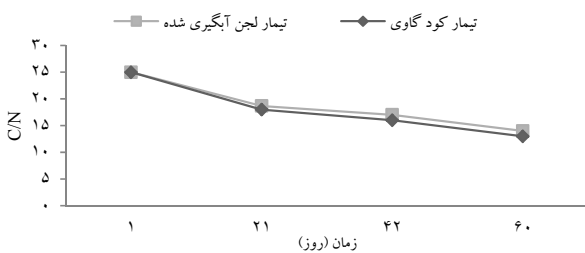
نمودار ۶- تغییرات نسبت (C/N) طی فرایند کمپوست‌سازی راکتوری

روند تغییرات نسبت کربن به ازت روند کاهشی داشته و در انتهای فرایند به حد استاندارد (کمتر از ۱۵:۱) رسید ( P \leq 0/005 ). در تیمار کود گاوی از ۲۵:۱ به ۱۳:۱ و لجن آبگیری شده فاضلاب از ۲۵:۱ به ۱۴:۱ رسید (نمودار ۶).