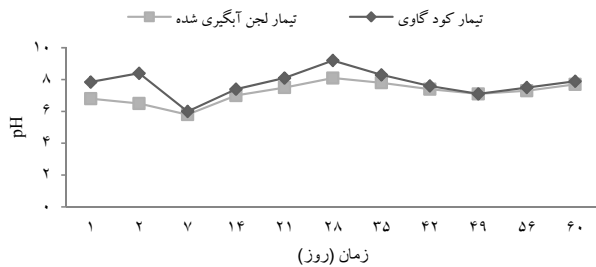
نمودار ۳- تغییرات pH طی فرایند کمپوست‌سازی راکتوری

در هر دو تیمار EC به طور معناداری ( P \leq 0/009 ) روند افزایشی داشت. در تیمار کود گاوی از ۱/۴ mmhos/cm به ۳/۱ mmhos/cm و در تیمار لجن آبگیری شده فاضلاب از ۱/۲ mmhos/cm به ۲/۹ mmhos/cm رسید (نمودار ۴).