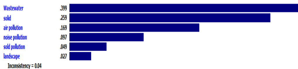
نمودار ۱- مقایسه زوجی آلودگی‌های زیست محیطی مورد مطالعه

مشاغل گروه ۴ وزن ۰/۵۶۵، مشاغل گروه ۳ وزن ۰/۲۶۲، مشاغل گروه ۲ وزن ۰/۱۱۸ و مشاغل گروه ۱ وزن ۰/۰۵۵ را دارند. به‌منظور مشخص شدن وزن نهایی و رتبه‌بندی مشاغل آلاینده پس از تلفیق وزن هر یک از آلودگی‌ها با گروه مربوطه (نمودار