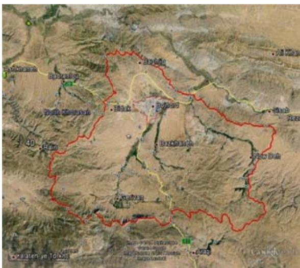
شکل ۱- حوضه آبخیز شهری بجنورد

ابنیه اصلی و مهم شهر همچون مجتمع‌های دانشگاهی و بیمارستان‌ها در بخش جنوبی شهر، عمارت مفخم و آینه‌خانه در مرکز شهر، استادیوم ورزشی و فرودگاه بجنورد در شمال غرب محدوده شهر و همچنین شهرک‌های صنعتی در غرب شهر واقع شده‌اند. بیشترین میزان ترافیک در خیابان‌های طالقانی و امام خمینی و بلوار نیروگاه است که در جهت شرقی غربی گسترش یافته‌اند و از مرکز ثقل شهر عبور می‌کنند (۷).