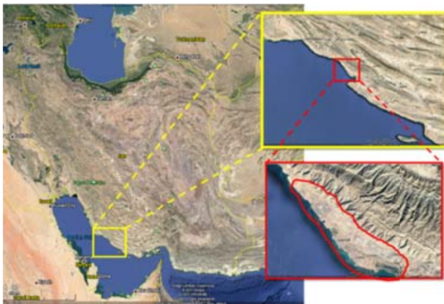
شکل ۱- موقعیت مکانی منطقه ویژه اقتصادی انرژی پارس

این تحقیق سعی بر تهیه و تفسیر کمی و کیفی انتشار ترکیبات آلی از منطقه پارس جنوبی و سپس اولویت‌بندی این ترکیبات