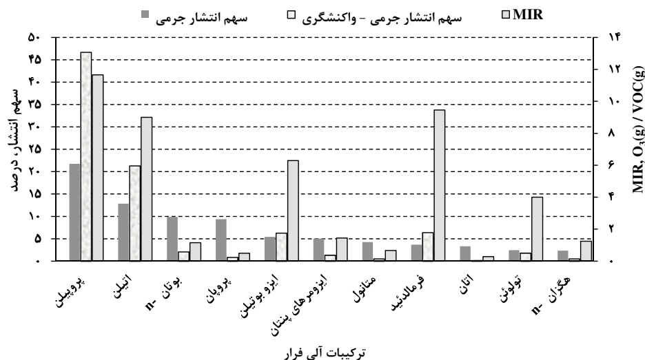
نمودار ۱- مقایسه سهم VOCs در فهرست جرمی (درصد) و فهرست جرمی - واکنشگری (درصد) و مقادیر MIR