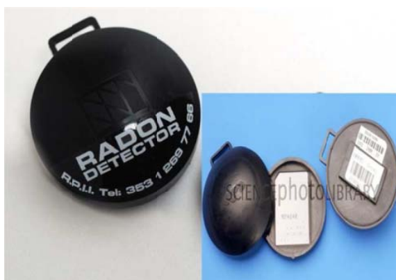
شکل ۲- آشکارساز Alpha Track مجهز به فیلم پلیمری CR-39

که در آن: D ، دوز مؤثر سالیانه بر حسب C \text{ mSv} ، غلظت رادن ( Bq/m^3 )، F فاکتور تعادل بین رادن و محصولات واپاشی آن ( 0.4 برای اندازه‌گیری‌های داخلی)، H فاکتور اشغال ( 0.8 برای اندازه‌گیری‌های داخلی)، T مدت زمان اقامت به ازای یک سال ( 8766 \text{ h} به ازای یک سال مواجهه) و F' فاکتور تبدیل دوز ( 0.9 \text{ nSv.Bq/m}^3 به ازای هر ساعت) است.