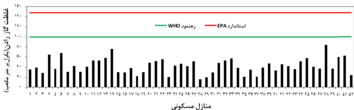
نمودار ۱- مقایسه میانگین غلظت گاز رادن در منازل مسکونی شهر نورآباد با استانداردهای WHO و EPA

در این مطالعه غلظت گاز رادن برای اولین بار در منازل مسکونی و اماکن عمومی شهر نورآباد اندازه‌گیری شد. نتایج به‌دست آمده از این پژوهش میانگین غلظت 42/4 Bq/m^3 برای منازل مسکونی و 32/9 Bq/m^3 برای اماکن عمومی را