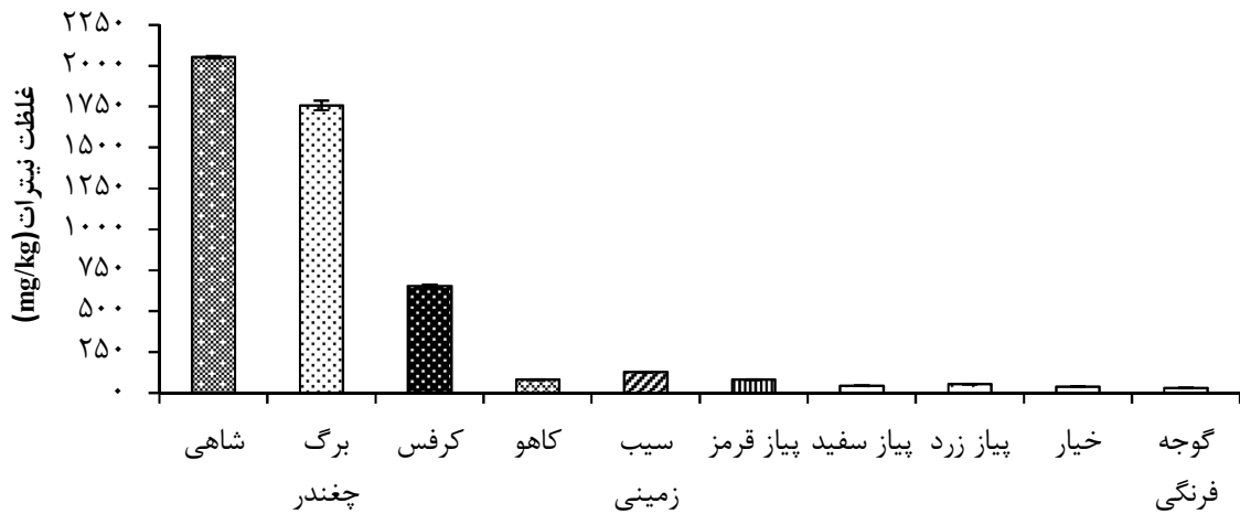
نمودار ۲- میانگین غلظت نیترات براساس وزن تر در سبزیجات مختلف موجود در بازارهای تره‌بار شهر کرمانشاه