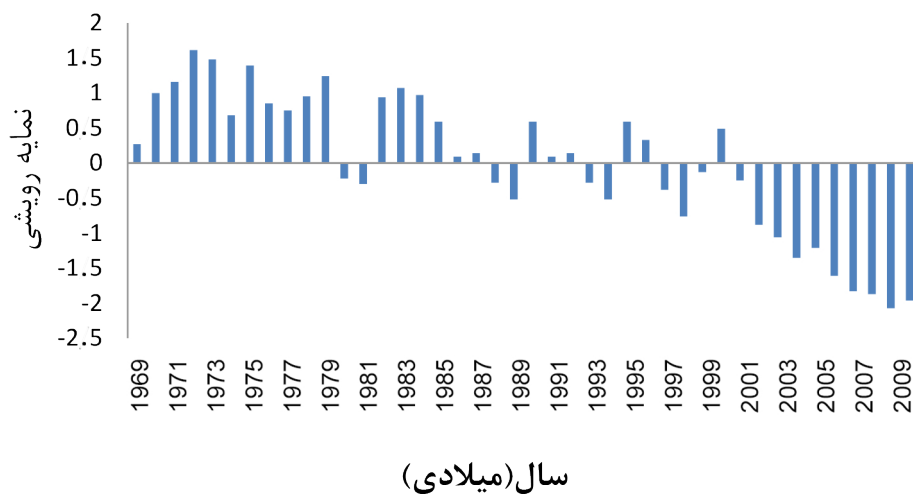
نمودار ۲- نمایه رویشی درخت کاج در پارک جنگلی چیتگر

بین این آلاینده ها منوکسید کربن، اوزون و دی اکسید نیتروژن بیشترین همبستگی و تاثیرگذاری را بر رویش درختان کاج داشته اند.