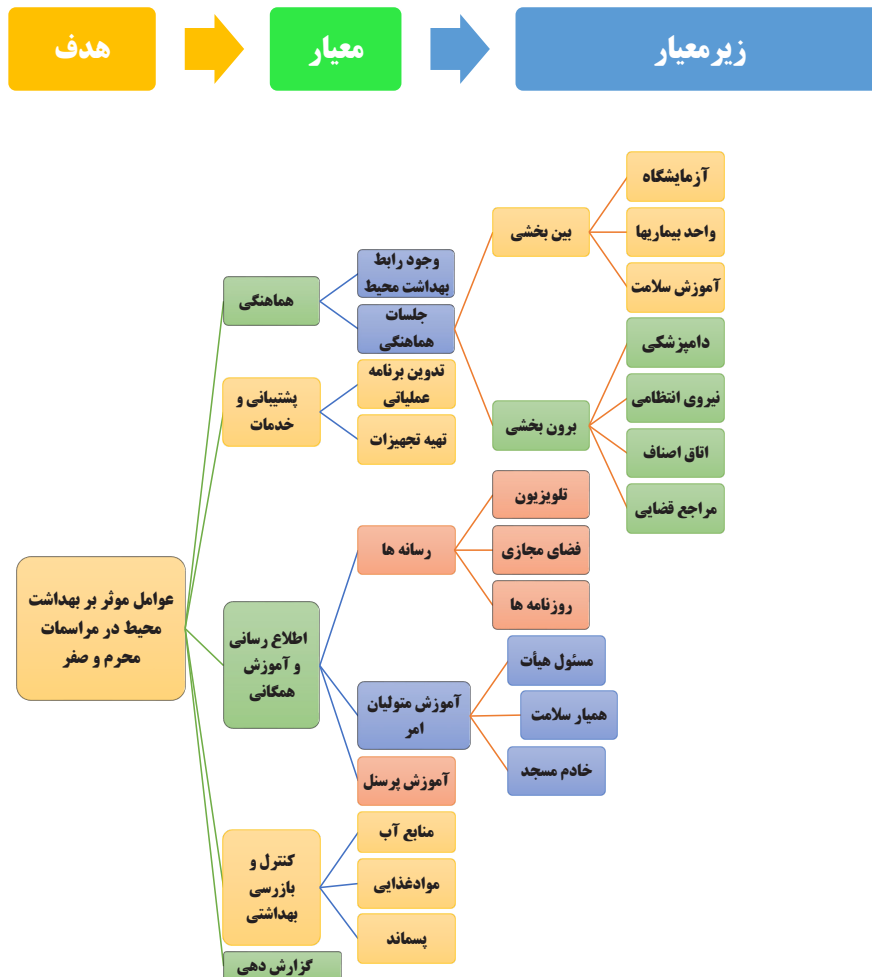
شکل ۱- معیارها و زیرمعیارهای موثر بر حفظ بهداشت محیط در مراسم عزاداری محرم و صفر

بررسی شرح وظایف مدیریت بهداشت محیط، حاکی از ۵ عنصر اصلی و حاکم بر سیاستگذاری در روال اجرایی امور