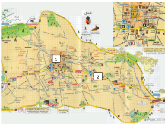
شکل ۱: نقشه شهر تبریز و موقعیت ایستگاه‌های اندازه‌گیری صدا

این پژوهش یک مطالعه از نوع توصیفی - مقطعی است. هدف از اندازه‌گیری آلودگی صدا در نقاط پرتراپیک شهر تبریز مشخص نمودن وجود آلودگی صوتی در این شهر است. لذا ۲ نقطه شلوغ، پرتراپیک و حساس شهر تبریز از نوع منطقه تجاری و تجاری-مسکونی برای این موضوع انتخاب گردید و روزانه در ۳ نوبت صبح (از ساعت ۷/۳۰ الی ۹/۳۰)، ظهر (از ساعت ۱۲/۳۰ الی ۱۴/۳۰) و شب (از ساعت ۱۹ الی ۲۱) مطابق روش اعلام شده از سوی سازمان EPA و به‌طور هم‌زمان در دو ایستگاه منتخب انجام گرفته و بر حسب دسی‌بل در فرم‌های طراحی شده برای این منظور ثبت گردید. این اندازه‌گیری‌ها به مدت یک ماه تداوم یافت، به طوری که در هر یک از روزهای ایام هفته حداقل ۴ مرتبه سنجش در سه بازه زمانی مشخص شده صورت گرفته و در مجموع ۱۸۰ رکورد در طی این یک ماه نمونه برداری به‌دست آمد. داده‌های حاصل با استفاده از آمار توصیفی نرم افزار SPSS، مورد تجزیه و تحلیل آماری قرار گرفته و نمودارها در نرم افزار Excel رسم شدند. تراز معادل فشار صوت در ایستگاه‌ها با استانداردهای مربوط به صدا در هوای آزاد ایران به‌صورت روزانه (۷ صبح الی ۱۰ شب) مورد مقایسه قرار گرفت.