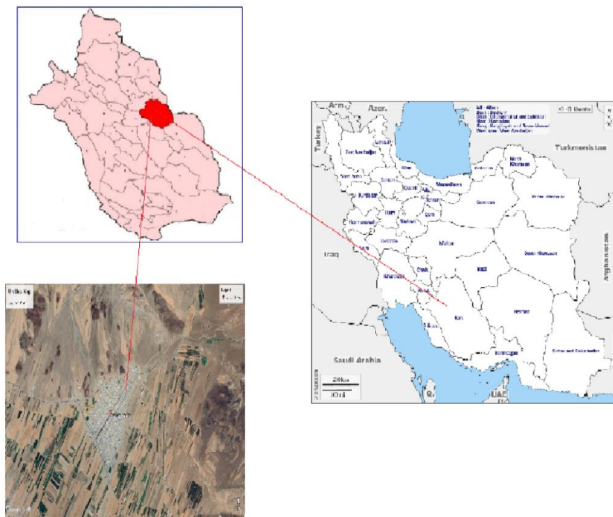
شکل ۱- موقعیت جغرافیایی شهر آباده طشک شهرستان بختگان استان فارس