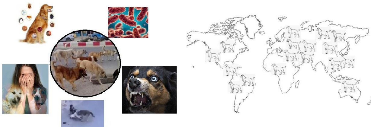
شکل ۲- توزیع موضوعی و مکانی مطالعات وارد شده به این مرور

را تشکیل می داد کمترین تعداد مقالات در طبقه بندی سال انتشار مقالات را شامل می شد. همچنین بررسی موضوعی مقالات وارد شده به این مطالعه نشان داد موضوعات مرتبط با بیماری‌های باکتریایی و انگلی سگ‌های ولگرد در سال‌های اخیر بیشتر مورد توجه محققان و پژوهشگران بوده است.