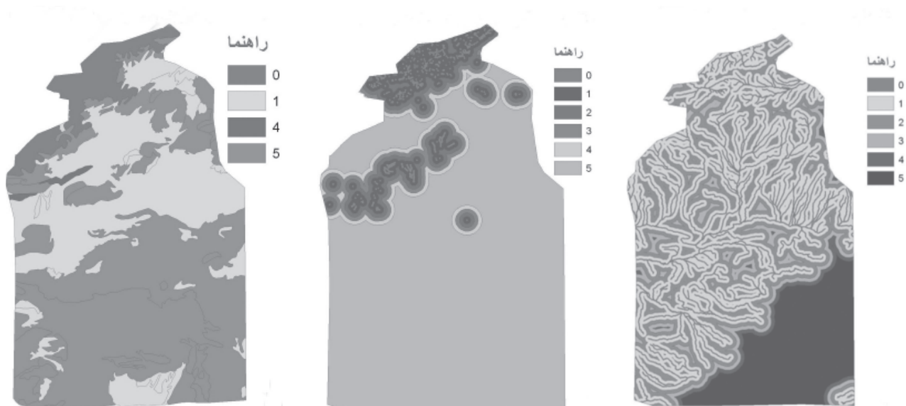
شکل ۳: رتبه بندی واحدهای زمین شناسی