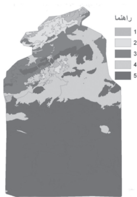
شکل ۷: رتبه بندی کاربری اراضی