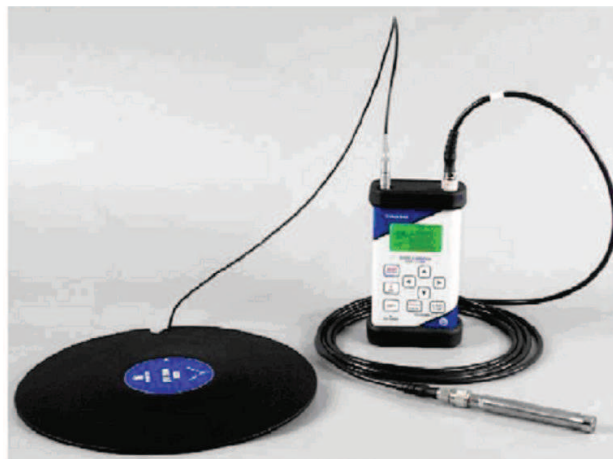
شکل ۱: نمایی از دستگاه ارتعاش سنج مدل SVAN 958