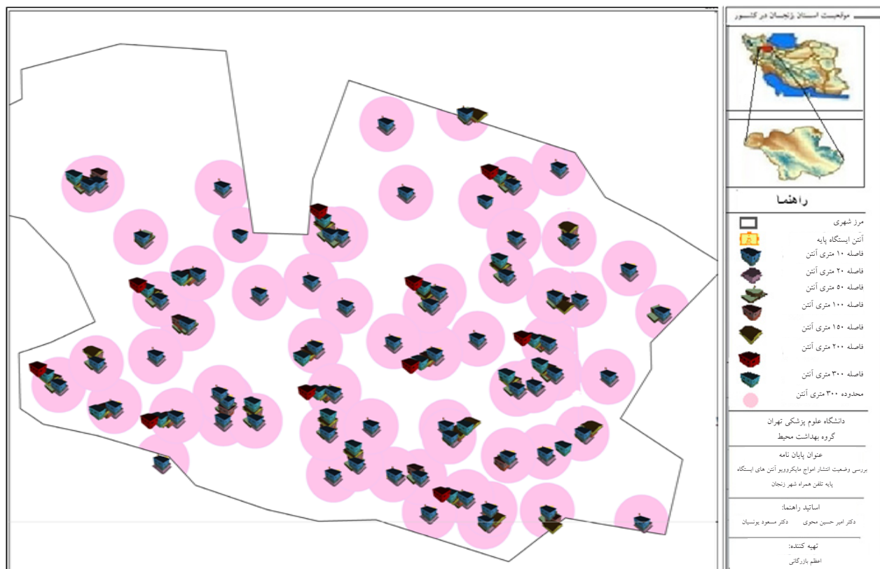
شکل ۲: نقاط انتخاب شده جهت بررسی شارچگالی توان امواج مایکروویو در محیط‌های درونی مجاور ایستگاه های پایه

با توجه به نتایج حاصل از تحلیل واریانس تک متغیره و مقایسه دو به دو میانگین چگالی توان امواج مایکروویو (فاصله و ارتفاع)، در فاصله اطمینان ۹۵٪ بین میانگین اندازه‌گیری‌ها در فواصل ۰، ۳، ۶، ۹، ۱۲، ۲۰، ۵۰، ۱۰۰، ۱۵۰، ۲۰۰، ۳۰۰، ۵۰۰، ۱۰۰۰ متر معنی‌دار در تمام فواصل ۰، ۳، ۶، ۹، ۱۲، ۲۰، ۵۰، ۱۰۰، ۱۵۰، ۲۰۰، ۳۰۰، ۵۰۰، ۱۰۰۰ متر معنی‌دار آماری ( P\text{-value} < 0.05 ) مشاهده شد. مقایسه دو به دو میانگین چگالی توان امواج مایکروویو در ارتفاع‌های مختلف نشان‌دهنده ارتباط معنی‌دار آماری ( P\text{-value} < 0.05 ) بین میانگین اندازه‌گیری‌ها در ارتفاع‌های ۰، ۳، ۶، ۹، ۱۲، ۲۰، ۵۰، ۱۰۰، ۱۵۰، ۲۰۰، ۳۰۰، ۵۰۰، ۱۰۰۰ متر (همکف) با میانگین سنجش‌ها در کل ارتفاع‌ها در فاصله اطمینان ۹۵٪ است. با افزایش ارتفاع چگالی توان نیز افزایش یافت. جهت بررسی همبستگی میان متغیرهای مستقل و متغیر وابسته از رگرسیون خطی چند متغیره استفاده گردید. با توجه به R^2 به دست آمده که عدد ۰/۷۹ است. در این داده‌ها متغیر فاصله و ارتفاع تواما تقریبا ۷۹٪ از واریانس چگالی توان امواج مایکروویو در محیط‌های درونی را توجیه می‌کند.