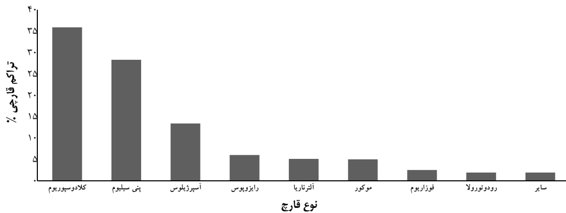
نمودار ۱- درصد فراوانی گونه‌های قارچی جدا شده در بخش‌های مورد بررسی

موارد نسبت I/O < 1 بوده که نشانه ورود آلودگی قارچی از محیط بیرونی به محیط داخلی است. بررسی تغییرات فصلی بر روی رشد و تکثیر قارچ‌ها توسط آزمون آماری من-ویتنی نشان داد که بین میزان آلودگی قارچی در فصل زمستان و بهار تفاوت معنی‌داری وجود دارد ( P < 0.001 ).