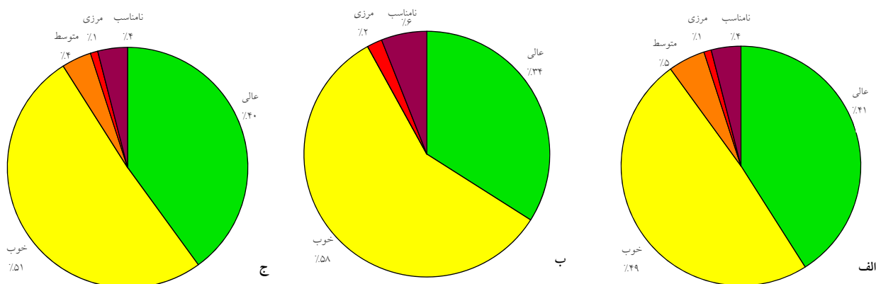
نمودار ۲- طبقه‌بندی کیفیت میکروبی آب استخرهای عمومی شهر تهران به تفکیک جنسیت: (الف) استخرهای بانوان، (ب) استخرهای آقایان و (ج) کل استخرها

توصیف و طبقه‌بندی کیفیت میکروبی آب استخرهای عمومی شهر تهران به تفکیک جنسیت در نمودار ۲ آورده شده است. همانطور که در این نمودار مشاهده می‌شود، کیفیت میکروبی آب بیشتر استخرهای مورد بررسی (هم استخرهای آقایان و هم استخرهای بانوان) در محدوده عالی و خوب قرار داشت، بطوری که از مجموع ۳۰۲ استخر مطالعه شده، کیفیت میکروبی آب در ۱۲۰ استخر عالی و در ۱۵۳ استخر خوب ارزیابی شد.