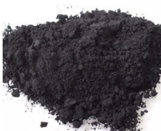
شکل ۲- بیوچار پوسسته انار استفاده شده در این پژوهش

- اثر تیمارهای مورد آزمایش بر ویژگی های شیمیایی خاک بیشترین و کمترین pH خاک به ترتیب در خاک کاربرد بیوچار و خاک فاقد بیوچار مشاهده شد. کاربرد ۱۵g/kg بیوچار به همراه ۲۰ ton/ha کمپوست پسماند شهری شازند ( \text{C}_{20}\text{B}_1 ) باعث افزایش ۰/۴ واحدی در pH خاک شد (نمودار ۱-الف). همچنین نتایج این پژوهش حاکی از آن است که کاربرد ۱۰ و ۲۰ ton/ha کمپوست پسماند شهری در خاک فاقد بیوچار پوسسته انار به ترتیب باعث افزایش ۱/۲ و ۳/۱ درصدی در کربن آلی خاک شده است. اثر ساده کاربرد کمپوست زباله شهری بر ظرفیت تبادل کاتیونی خاک معنی دار بود، به نحوی که کاربرد ۲۰ ton/ha کمپوست