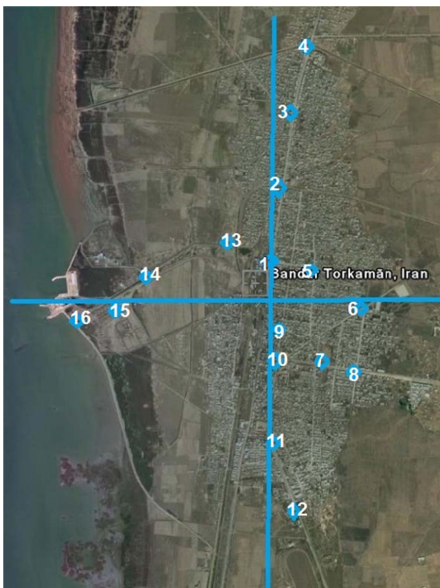
شکل ۲- ایستگاه‌های اندازه‌گیری آهنگ دز گامای محیطی در فضای باز در شهر بندر ترکمن

به دست آمده پس از طبقه بندی، توسط نرم افزار Excel و با آزمون آماری T (T-test) مورد تجزیه و تحلیل قرار گرفت. استان گلستان در شمال ایران واقع شده است و طول و عرض جغرافیایی شهرهای گرگان به ترتیب 54/16 و 36/58 درجه و بندر ترکمن 54/04 و 36/54 درجه است. شهر گرگان با وسعتی بیشتر از 60 \text{ km}^2 طبق آخرین سرشماری سراسری که در سال