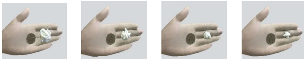
تصویر ۱ تصویر ۲ تصویر ۳ تصویر ۴

۹. لطفاً برای هر محصول مراقبت شخصی در زیر تصویری را انتخاب کنید که نشان‌دهنده مقدار متوسطی است که شما در هر بار استفاده می‌کنید.