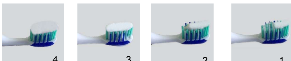
تصویر ۱ تصویر ۲ تصویر ۳ تصویر ۴