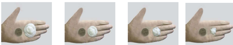
تصویر ۱ تصویر ۲ تصویر ۳ تصویر ۴