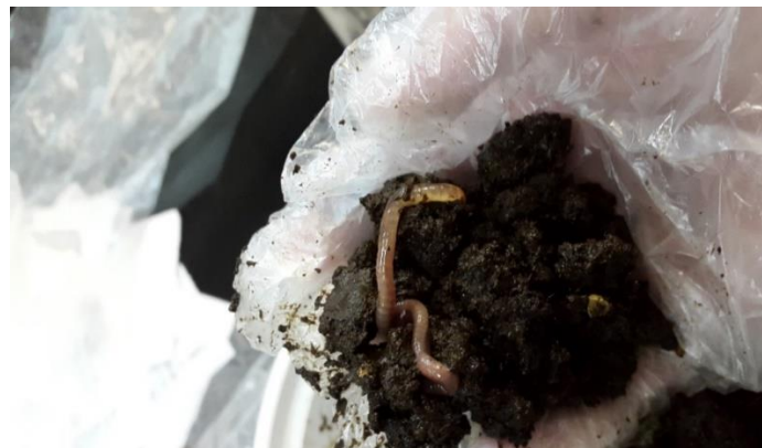
شکل ۱- نمونه کرم خاکی مورد استفاده در مطالعه

- تهیه کمپوست و کرم خاکی ایزنیافتیدا کمپوست و کرم خاکی ایزنیافتیدا مورد استفاده در این مطالعه از سایت کمپوست گاوی شهر هشتگرد تهیه شد (شکل ۱).