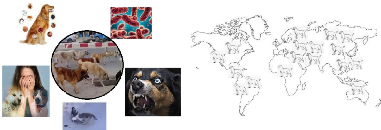
شکل ۲- توزیع موضوعی و مکانی مطالعات وارد شده به این مرور

را تشکیل می داد کمترین تعداد مقالات در طبقه بندی سال انتشار مقالات را شامل می شد. همچنین بررسی موضوعی مقالات وارد شده به این مطالعه نشان داد موضوعات مرتبط با بیماری‌های باکتریایی و انگلی سگ‌های ولگرد در سال‌های اخیر بیشتر مورد توجه محققان و پژوهشگران بوده است.