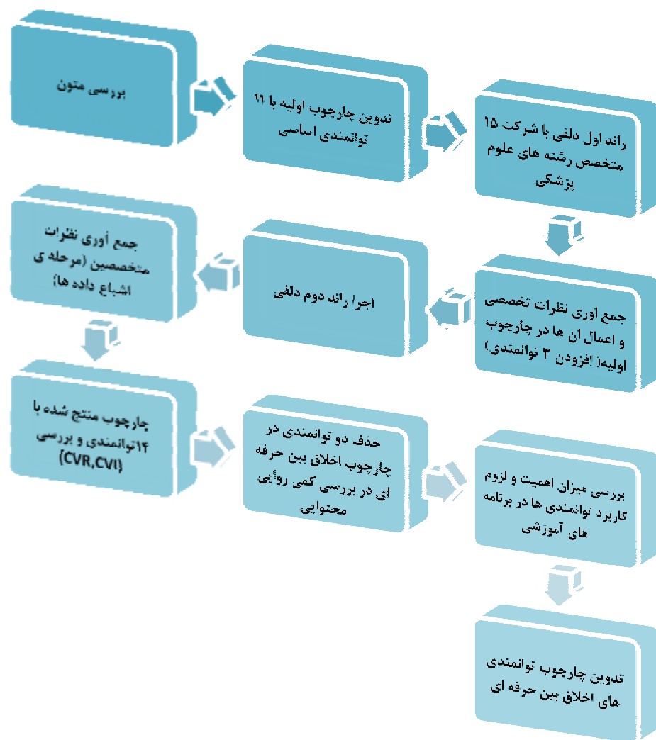
نمودار شماره ۱ - مراحل اجرایی مطالعه

در نهایت، باتوجه به هدف کاربردی مطالعه، نظرات ۲۵ نفر از متخصصان رشته‌های مختلف علوم پزشکی (علوم پایه، علوم بالینی، پرستاری و علوم توانبخشی) در رابطه با میزان