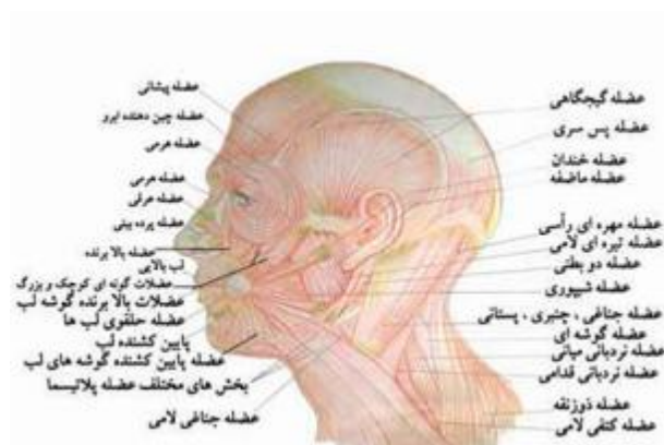
تصویر شماره ۲- انواع عضلات سر و صورت

نوع عضلات، شرکت در حرکات بدن است. انقباض این عضلات، سریع و قدرتمند است و معمولاً، تحت کنترل ارادی‌اند (۴۸). هر یک از عضلات اسکلتی، به تناسب جایگاه یا کارکردی که دارند، عنوانی خاص گرفته‌اند. در تصویر زیر، انواع عضلات سر و صورت، با عناوین خاص آن‌ها، دیده می‌شود؛ البته در این تصویر، برخی از عضلات گردن نیز، نمایش داده شده‌اند. عضلات گردن، بستر اصلی شجاج نیستند و مشمول عضلات سر و صورت نمی‌شوند: