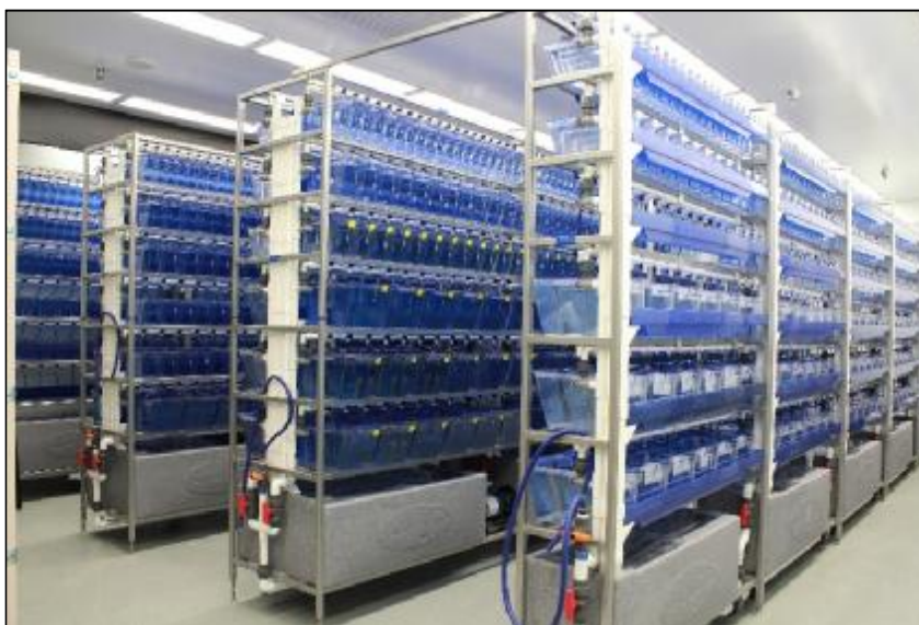
تصویر شماره‌ی ۴- لابراتوار اختصاصی تولید ماهی گورخری دانشگاه دالهاوزی کانادا، آزمایشگاه دکتر برمن.

گورخری، به تولید به‌موقع و مداوم تخم و جنین با کیفیت بالا برای آزمایش بستگی دارد. درک رفتارهای تولید مثلی ماهی در حیات‌وحش و به تبع آن در محیط اسارت، نوآوری‌هایی را در تکنیک‌های پرورش و تجهیز ادوات آزمایشگاهی موجب شده است (۵۰). یک نمونه‌ی شایسته‌ی توجه از این ادوات آزمایشگاهی پیشرفته، استفاده از مخازن تخم‌ریزی iSpawn است که در حال حاضر در کشور وارد نشده اما امکان واردات و حتی تولید آن توسط متخصصان داخلی به‌راحتی ممکن است. این مخازن برای تخم‌ریزی ماهی گورخری طراحی و تولید شده است و امروزه به‌صورت تجاری شده در اقصا نقاط