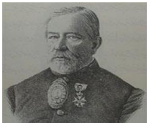
دکتر ژوزف دزیره طولوزان

حضور فرانسه در ایران عهد قاجار، در حوزه‌های سیاسی، نظامی، اجتماعی، فرهنگی و مذهبی، حضوری همه‌جانبه، منسجم و هماهنگ بوده است. از جمله حوزه‌های اجتماعی و فرهنگی، مقوله‌ی طبابت است که از بهترین ابزارهای توجیهی حضور آن کشور در موقعیت‌های گوناگون بود. پزشکان فرانسوی در دربار شاهان قاجار و در میان عامه‌ی مردم حضوری پررنگ و فعال داشتند. آنان به غیر از طبابت، در امور دیگر نیز فعالیت می‌کردند؛ به‌عنوان نمونه، گاهی اطلاعات مهم سیاسی را به مقامات سیاسی گزارش می‌دادند؛ به‌گونه‌ای که بسیاری از پزشکان درباری فرانسوی، ابتدا، از پزشکان ارتش فرانسه بودند که به تدریج، به ایران اعزام و گاهی برای پیشبرد اهداف سیاسی دولت متبوع خود، وارد شهرهای مختلف شدند. همکاری با جریان‌های میسیونری و استفاده از حرفه‌ی خود در هموارکردن راه تبلیغ میسیونرها، یکی دیگر از زمینه‌های فعالیت پزشکان فرانسوی بود؛ بنابراین، بی‌شک، پیوندی ناگسستن میان عناصری مانند دین، مذهب و سیاست با طبابت، در اهداف و عملکردها وجود داشته است؛ به‌گونه‌ای که حرفه‌ی انسان‌دوستانه و نوع‌دوستانه‌ی پزشکی در قالب تأسیس داروخانه‌ها، بیمارستان‌ها، ارائه‌ی امکانات پزشکی و...، از سویی، هم سبب جلب اعتماد عامه و هم در کانون توجه شاهان و درباریان قرار می‌گرفت. این امر سبب شد که فرانسه در ایران، از میان کشورهای اروپایی، بیشترین عملکرد و حضور پزشکی را در دربار قاجار و جامعه‌ی ایران داشته باشد که صرف‌نظر از همه‌ی منافع کسب‌شده برای دولت وقت فرانسه، سبب تحول در تاریخ پزشکی نوین ایران شد. بیشترین اعزام محصل به کشورهای اروپایی و بیشترین تعداد پزشک خارجی در ایران، از کشور فرانسه و همچنین، بیشترین اعتبار و اعتماد دربار شاهان قاجار برای طبیبان فرانسوی بود.